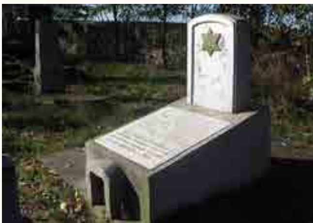
מצבת זכרון בבית העלמין דחאטיין