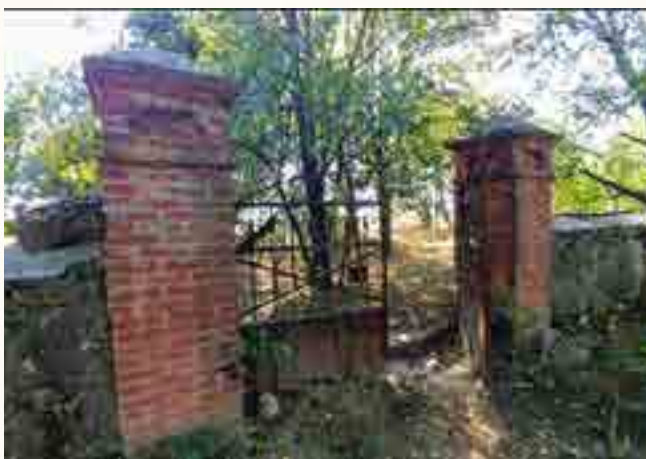
גדר ושער הכניסה לבית העלמין בחאטיין