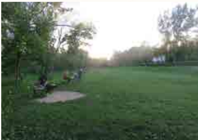
שוועלים הלכו בו. בית העלמין העתיק בשכונת טאטאראש ביאס שנחרב ופונה וכיום משמש גינה ציבורית במרכז יאס

הותיר אחריו ברכה כתבים מדברי תורתו, מהם נשאר בכת"י חידושים על חושן משפט (עשר עטרות לו, ב) וחבל על דאבדין ולא משתכחין.